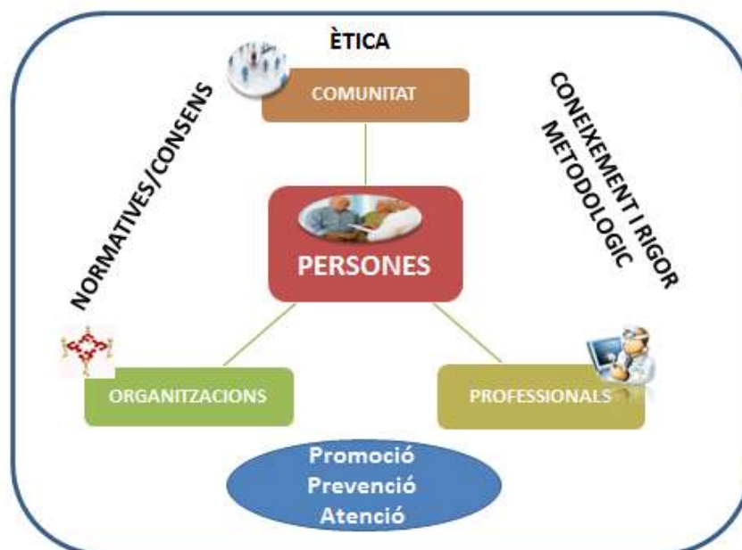
Fig. 1. Fonaments de l'ACP.